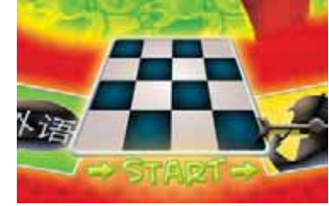
START-ruutu toimii myös maaliruutuna.

Aseta pöydälle pelilauta ja kortit kysymyspuoli alaspäin. Jaa jokaiselle pelaajalle nippu paperilappuja pelin mukana tulevasta lehtiöstä ja yksi kynä. Jokainen pelaaja ottaa itselleen pelinappulan ja asettaa sen START-ruutuun. Valitkaa keskuudestanne pelaaja, joka saa aloittaa ja olla Hämy ensimmäisen kierroksen ajan.