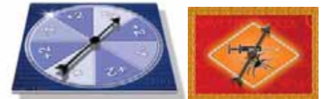
Kun saavut ruutuun, jossa on nuoli, pyöräytä spinneriä!

Pelaajat siirtävät pelinappuloitaan yhtä monta ruutua eteenpäin kuin saivat pisteitä. Jos pelaajat haluavat, pelissä voidaan jakaa myös tyyli pisteitä. Kun varsinaiset pisteet on laskettu, voidaan äänestää esimerkiksi kierroksen hauskimasta, typerimmästä tai oudoimmasta selityksestä. Äänestyksen voittaja saa aina yhden lisipisteen. Tyyli pisteitä ei ole pakko jakaa joka kierroksella.