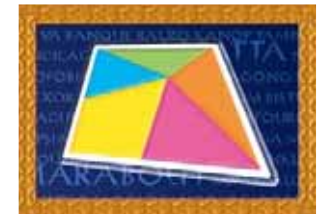
VAPAA VALINTA –ruutu

Aina kun pysähdyt ruutuun, jossa on spinnerinuolen kuva, pyöräytä spinneriä ja siirrä pelinappulaasi spinnerin osoittaman luvun verran joko eteenpäin (+) tai taaksepäin (-). Jos päädyt toiseen ruutuun, jossa on spinnerinuolen kuva, et saa enää pyöräyttää spinneriä vaan peli jatkuu normaalisti.